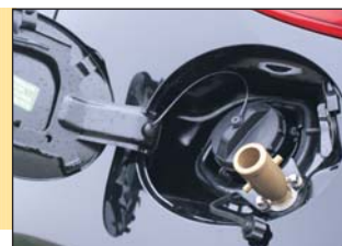
LPG-vulopening keurig weggewerkt achter tankklepje

snel mekkeren. Met een inhoud van 35 liter heb je een actieradius van 440 km, maar de indicator begint al na 170 km rood te knippen, terwijl je dan nog zo'n 270 km verder zou kunnen. Dat is toch een duidelijk minpuntje. De boordcomputer geeft trouwens alleen het benzineverbruik aan