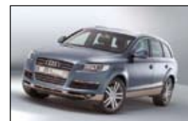
Audi Q7 3.0 TDI € 70.100,-