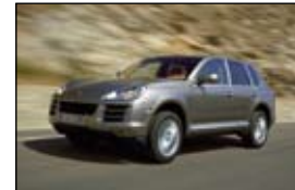
Porsche Cayenne € 71.600,-