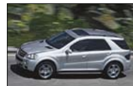
Mercedes ML 320 cdi € 71.700,-