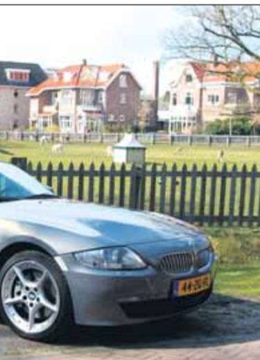
The Mark of Zorro!

We verkeerden tijdens onze testweek in de gelukkige omstandigheid topless te kunnen rondrijden: zon en blauwe lucht!